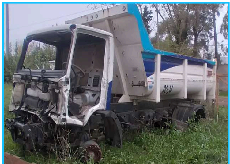
Dominio PKQ 123 en Presidente Perón - Informado como en desuso y deterioro total. Asegurado Provincia Seguros