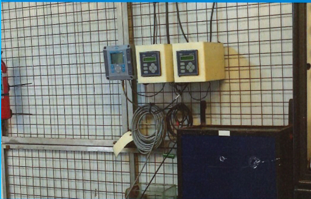
Medidor de Oxígeno disuelto marca Hach SC 200; Medidor de Conductividad marca GLI International; Medidor de Ph marca GLI International sin la identificación patrimonial Fecha de relevamiento: 1/08/2017