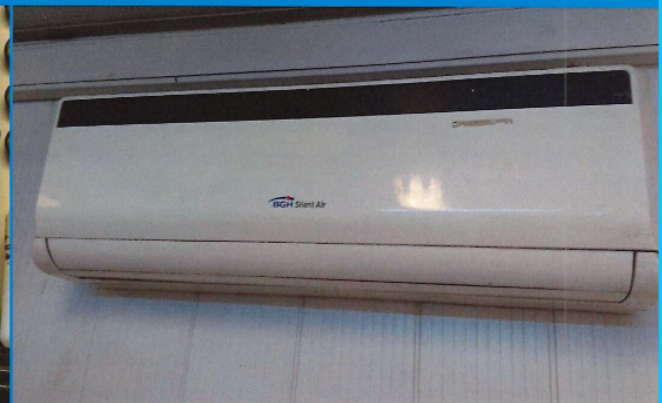
Aire acondicionado marca BGH sin la identificación patrimonial Fecha de relevamiento: 1/08/2017