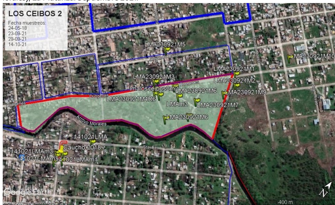
Figura 3. Distribución de puntos de muestreo realizado para Los Ceibos Sur (sector Arroyo Morales), La Matanza. Septiembre 2021.