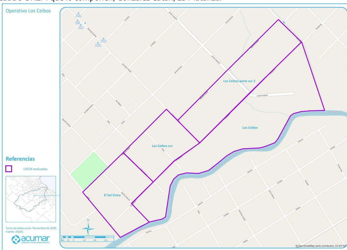
Figura 1. Mapa de Los Ceibos del sector arroyo Morales con demarcación de los límites de las cuatro UREM que lo componen, González Catán, La Matanza.

Nota: Las cuatro UREM que componen a Los Ceibos del sector arroyo Morales son El Sol Elvira, Los Ceibos, Los Ceibos Sur y Los Ceibos Sur parte 2