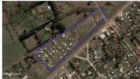
Figura 2. Glorias del Deporte - Ezeiza, imagen satelital del 2002. Soporte: Google Earth