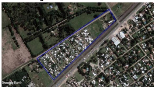
Figura 3. Glorias del Deporte - Ezeiza, imagen satelital del 2010.