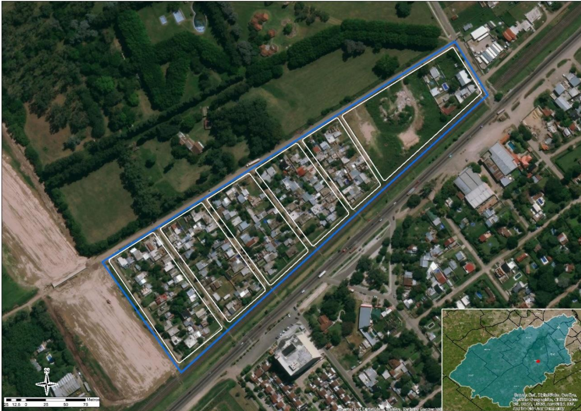
Figura 1. Glorias del Deporte – Ezeiza.