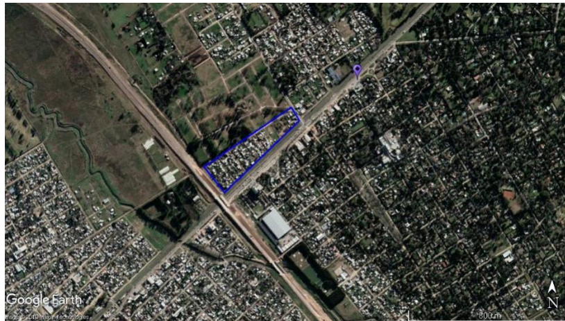
Figura 5. Glorias del Deporte – Ezeiza, y establecimientos empadronados.