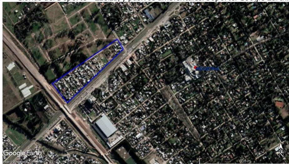
Figura 7. Glorias del Deporte – Ezeiza, y pasivos ambientales. Soporte: Google Earth.

En relación a los pasivos ambientales 28 , a menos de 500 metros del barrio se localiza una (1) industria que realizaba tareas vinculadas con la matanza de animales, el procesamiento de su carne y elaboración de subproductos cárnicos.