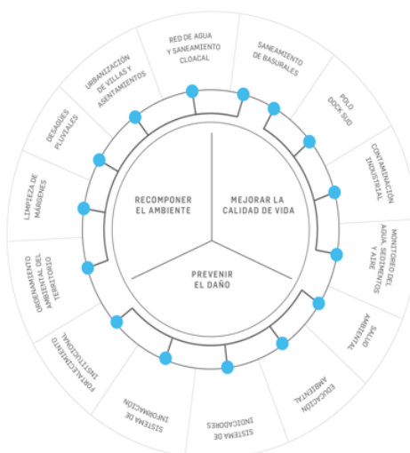
Plan Integral de Saneamiento Ambiental (PISA)

i) dejar de contaminar en el período más corto posible, ii) fortalecer las acciones de prevención socioambiental, iii) mejorar la calidad de vida de los habitantes de la cuenca, y iv) fortalecer el rol de la ACUMAR. Dejar de contaminar es un cambio de paradigma. Esta máxima es el inicio de toda política de remediación, pero principalmente implica un cambio de visión sobre las políticas públicas de la ACUMAR. En forma transversal, dejar de contaminar supone una redefinición, un establecimiento de límites y la obligación de cumplir la normativa; al tiempo que abre nuevos escenarios para revisar la legislación existente y ponerla al servicio de parámetros renovados a plasmar. Sea sobre vertidos, emisiones, existencia de basurales o contaminación del suelo, este camino implica actuar directamente sobre los principales focos de contaminación