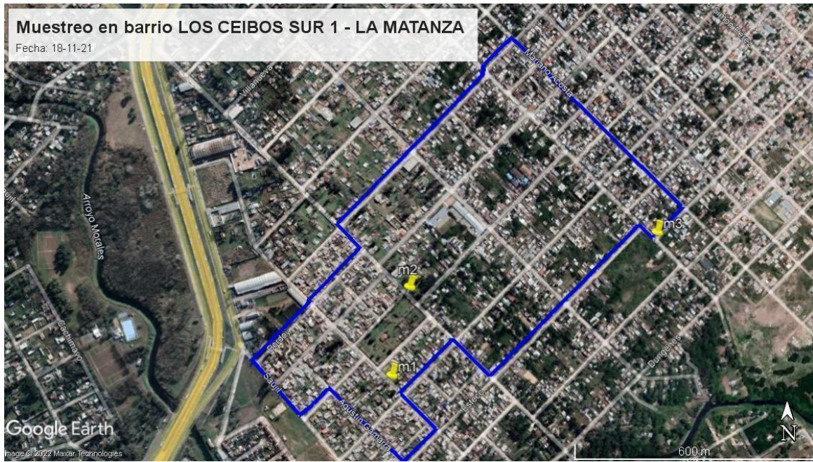
Figura 2. Mapa con distribución de puntos de muestreo de suelo superficial realizado en relación al barrio Los Ceibos Sur 1, González Catán, La Matanza