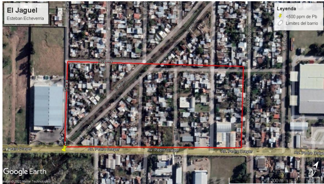
Figura 2. Punto de muestreo en El Jagüel, El Jagüel, Esteban Echeverría