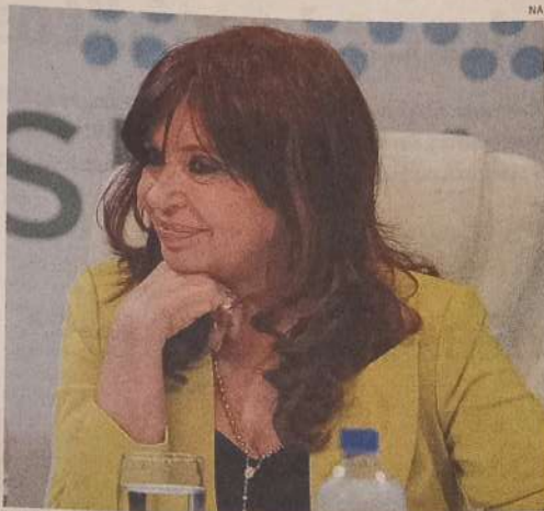
Cristina de Kirchner

Con el calendario electoral entrando en la recta final, cada movimiento de las principales figuras del país es observado con lupa. Hoy dará la nota Cristina Fernández de Kirchner, quien participará de un acto en Río Gallegos, Santa Cruz. La vicepresidenta reaparecerá apenas después del vencimiento