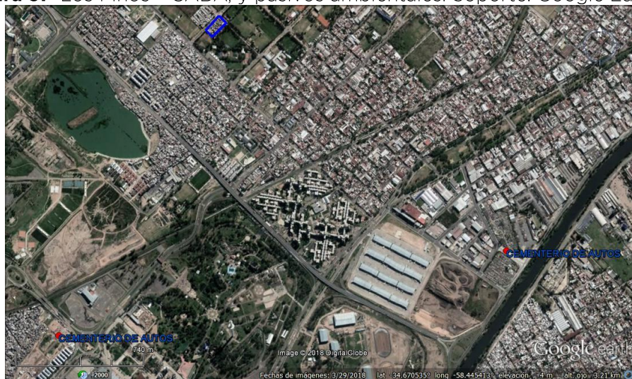
Figura 9. Los Pinos - CABA, y pasivos ambientales.

Respecto a los pasivos ambientales 30 , a 2.000 metros del barrio se localizan dos (2) cementerios de automóviles.