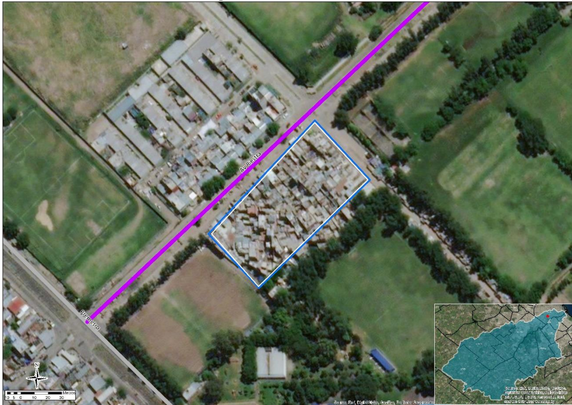
Figura 1. Los Pinos – CABA.