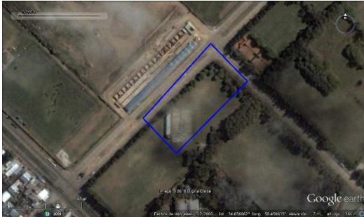
Figura 3. Los Pinos - CABA, imagen satelital del 2000.