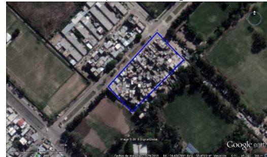
Figura 6. Los Pinos - CABA, imagen satelital del 2018. Soporte: Google Earth