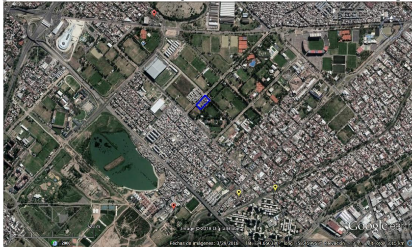
Figura 7. Los Pinos - CABA, y establecimientos.