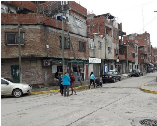
Foto 1. Los Pinos - CABA.