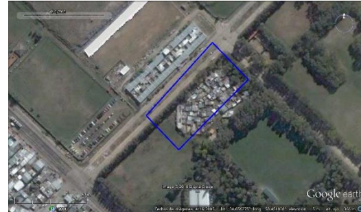
Figura 4. Los Pinos - CABA, imagen satelital del 2005.