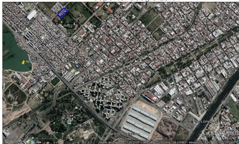
Figura 8. Imagen satelital de Los Pinos - CABA, y Estaciones de monitoreo.