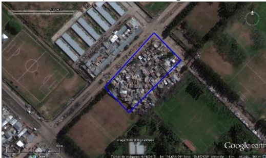
Figura 5. Los Pinos - CABA, imagen satelital del 2010.