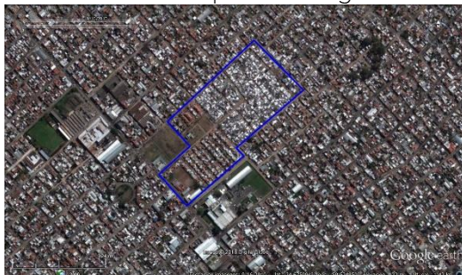
Figura 3. Las Antenas - La Matanza, imagen satelital del 2010. Soporte: Google Earth