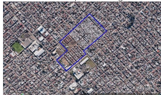
Figura 4. Las Antenas - La Matanza, imagen satelital del 2018.