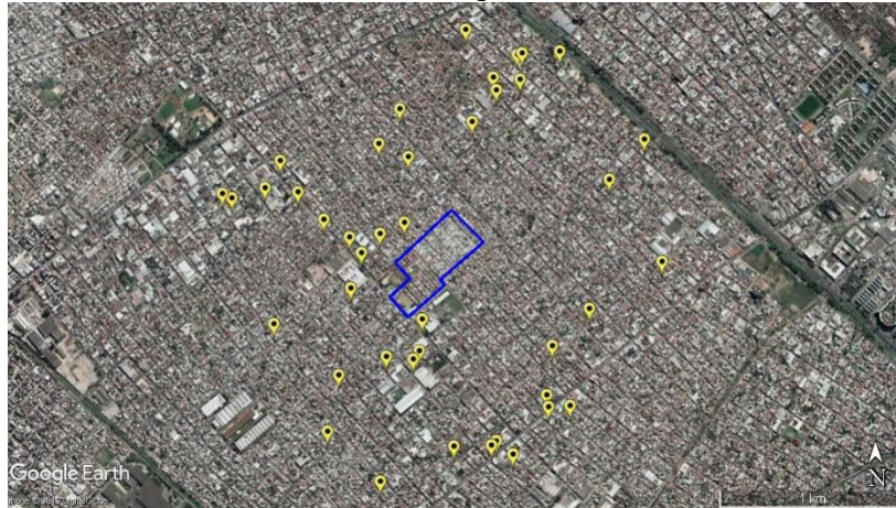
Figura 6. Las Antenas - La Matanza, y establecimientos no críticos. Soporte: Google Earth.