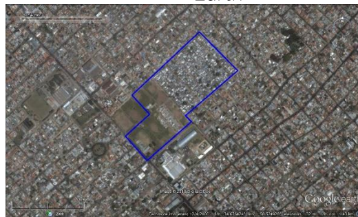
Figura 2. Las Antenas - La Matanza, imagen satelital del 2000.