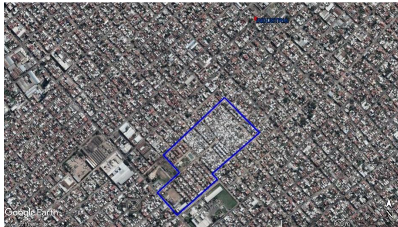
Figura 9. Las Antenas - La Matanza, y pasivos ambientales.

En relación a los pasivos ambientales 32 , a menos de 450 metros del barrio se localiza un pasivo industrial.