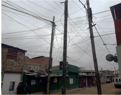
Foto 1. Las Antenas - La Matanza