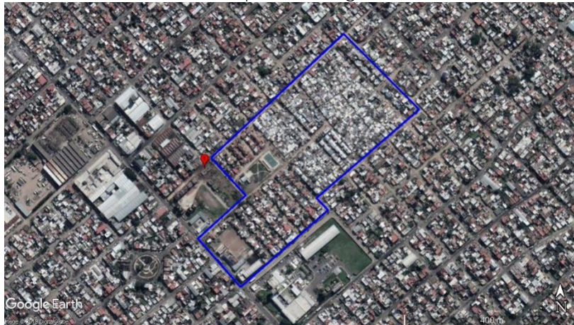
Figura 7. Las Antenas - La Matanza, y lugares de disposición de residuos. Soporte: Google Earth.