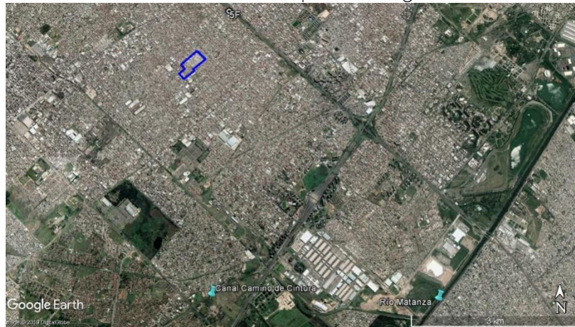
Figura 8. Imagen satelital de Las Antenas – La Matanza, y Estaciones de monitoreo.