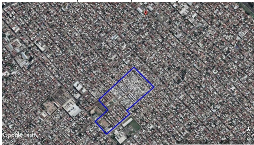
Figura 5. Las Antenas - La Matanza, y establecimientos de seguimiento particular.