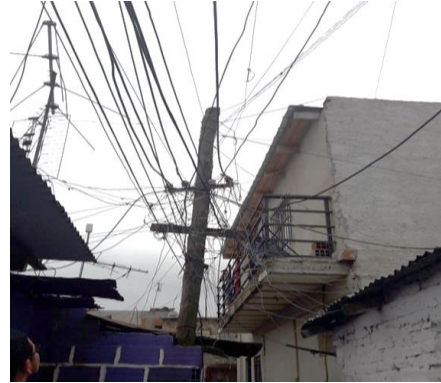
Foto 2. Las Antenas - La Matanza