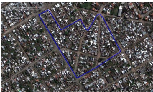
Figura 3. Edén - Lanús, imagen satelital del 2010.