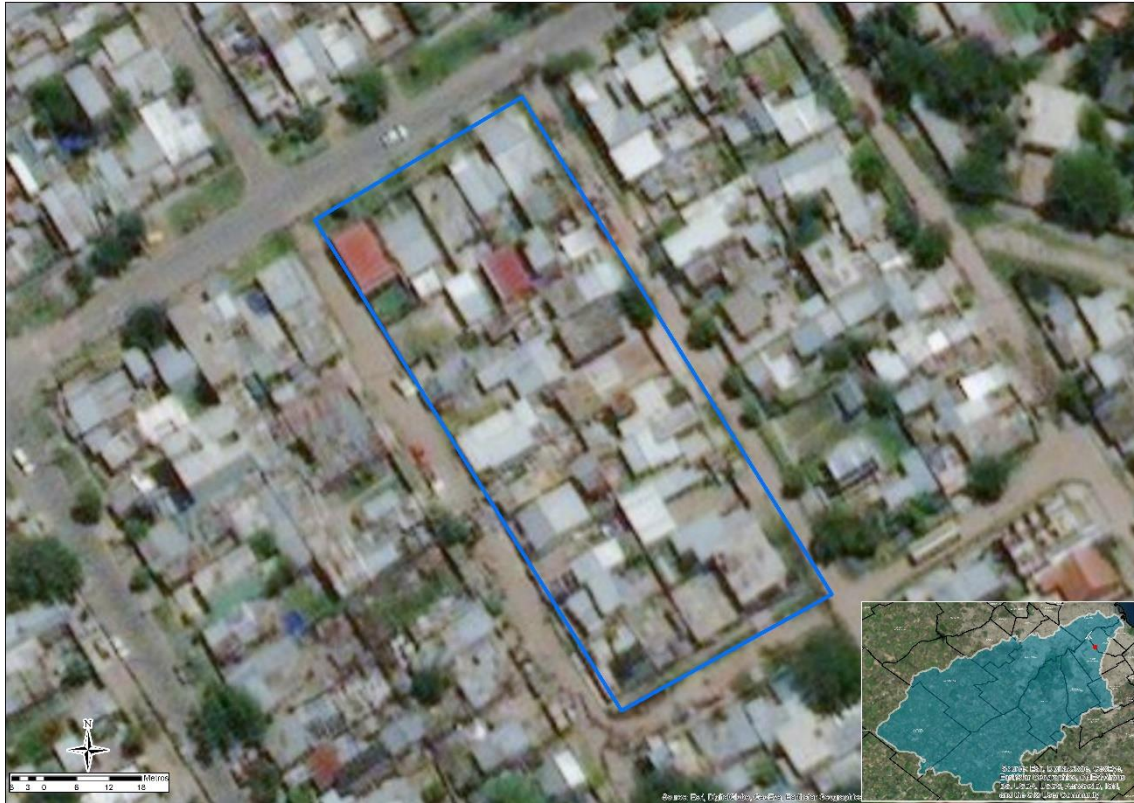
Figura 1. Edén - Lanús.