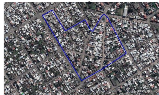
Figura 4. Edén - Lanús, imagen satelital del 2018. Soporte: Google Earth