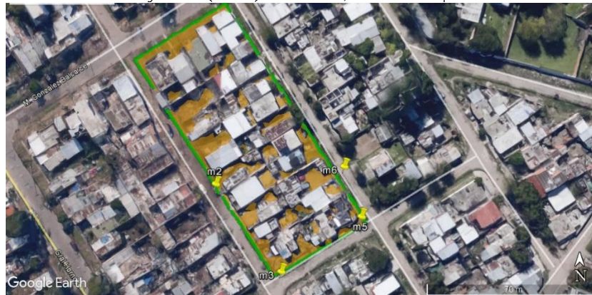
Figura 6. Esquema de sitios evaluados mediante equipo portátil de fluorescencia de rayos X (XRF). El Edén, Lanús. Septiembre 2018

en la figura que se presenta a continuación), con presencia de cromo y cadmio por encima de los valores de referencia para suelo residencial en dos de tres determinaciones, siendo los mismos producto de la propia quema; dado que no es una zona de juego o con posibilidad de otro tipo de contacto con la población, no se solicitaron nuevos estudios. Respecto al plomo, no se encontró presencia del mismo por encima de los valores de referencia 27 en ninguno de los sitios evaluados. La actividad se realizó luego de comunicar a la Secretaría de Salud del Municipio de Lanús que se recorrería el barrio para evaluar posibles fuentes de exposición y que de ser necesario se realizaría evaluación del suelo.